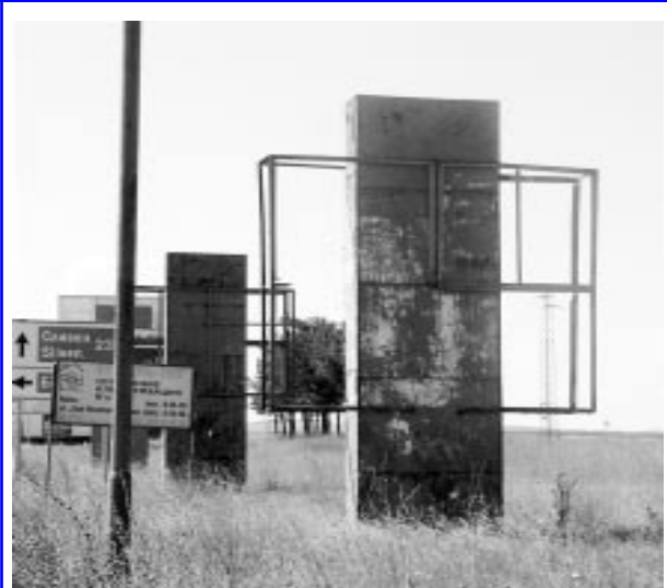
Билбордове от 70-те години на ХХ в. красят входа на Ямбол